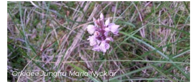
Orkidee Jungfru Maria Nycklar