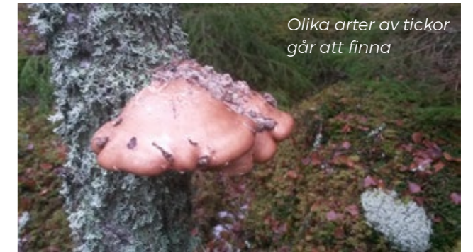
Olika arter av tickor går att finna