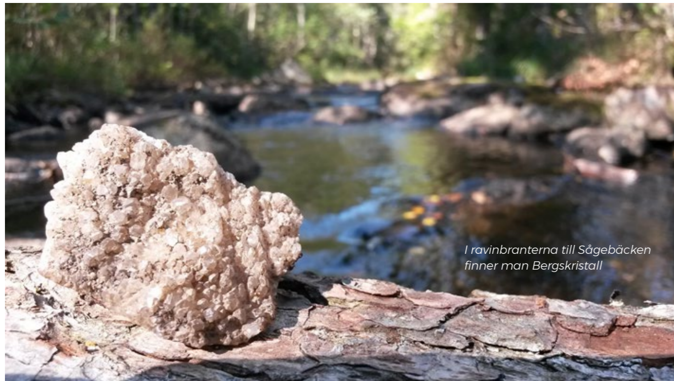
I ravinbranterna till Sågebäcken finner man Bergskristall