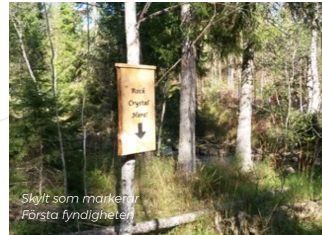
Skylt som markerar Första fyndigheten